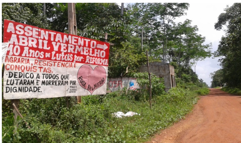
Figura 1 – Assentamento Abril Vermelho.

Reforma Agrária os assentados ainda não possuem o título da terra. Aproximadamente 1.500 famílias ligadas ao Movimento dos Trabalhadores Sem Terra (MST) ocuparam parte fazenda, mas, atualmente, o Assentamento tem em torno de 400 famílias assentadas e é dividido em lotes e organizado por quatro polos.